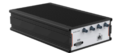
多路车载摄像头 注入盒 / 板卡